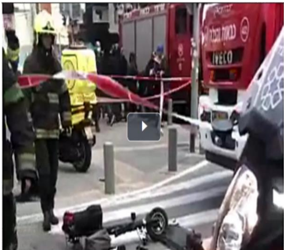
זוראו: רוכבת קורקינט חשמלי נהרגה מפגיעת משאית בתל אביב