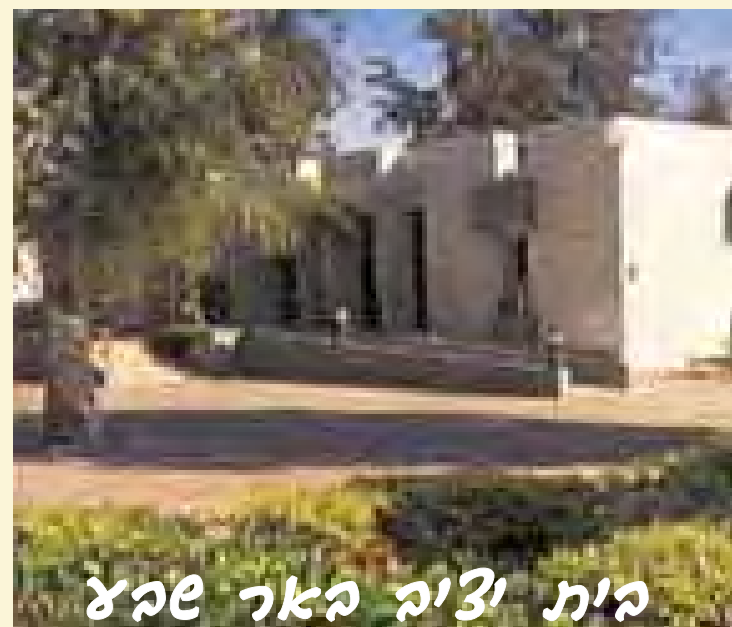
בית יציב באר שפא